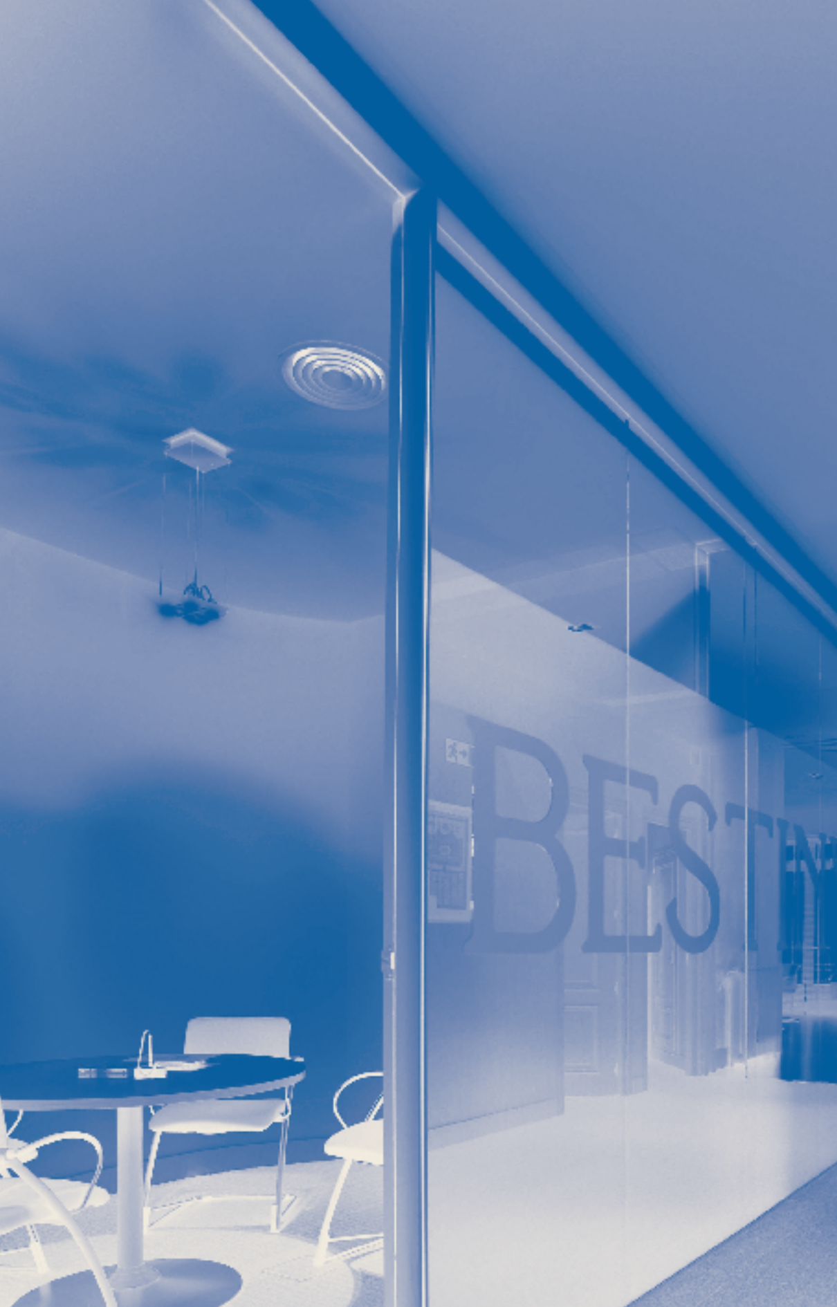
Bestinver Mixto, F.I.